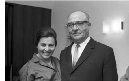
לוי ומרים אשכול. נכנס לבית סאלמן, וכעבור שנה נישא למרים. אשתו השלישית

את המרכז הקימה ומפעילה "יד לוי אשכול", מייסודה של מרים אשכול, אלמנתו של ראש הממשלה השלישי, שהלה לעולמה לפני כשבועיים. זו גולת הכותרת בהנצחתו של ראש הממשלה הנשכח-יחסית בזיכרון הציבורי, שלא בצדק: אשכול ייסד את חברת המים הלאומית "מקורות", כיהן כשר האוצר במשך 11 שנים בתקופה הקריטית של הקמת המדינה, היה ראש הממשלה שהכין את הצבא לינצחון הגדול של "מלחמת ששת הימים" אחרי מיתון חרף, ביטל את המשטר הצבאי שהושט על הערבים הישראלים, העלה לארץ את עצמותיו של זאב ז'בוטינסקי, ופתח את שידורי הטלוויזיה בארץ הקודש.