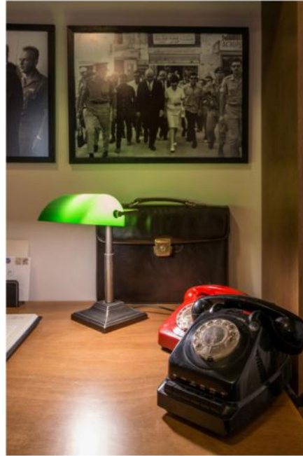
רחב הרחיים משחזרים את התקופה, אך קומץ מהם מקוריים