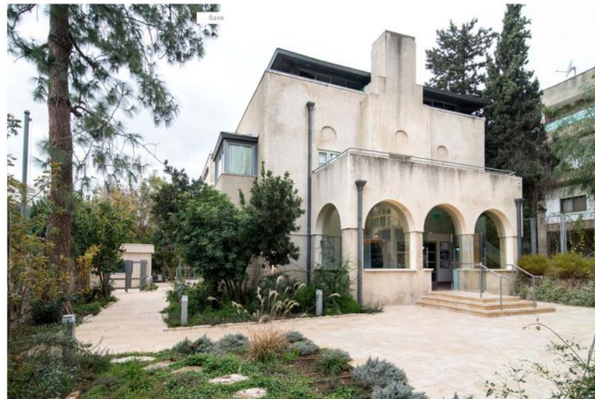
הבית בשדרות בן מימון 46 בשכונת רחביה. כאן התגורר דוד ופולה בן גוריון, אחריהם בני הזוג אשכול, וגם גולדה מאיר עד התפטרותה