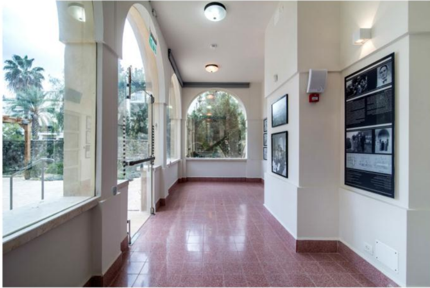
הבית משלב אדריכלות מודרניסטית עם קשתות יס-תיכונות, וגם ארוכה בסגנון ספרדי