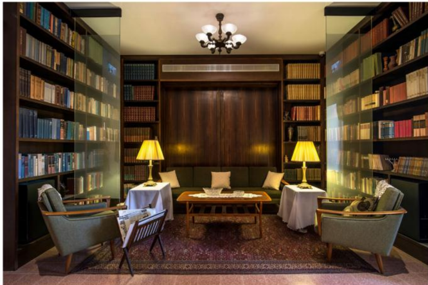
את פניהם של המבקרים בבניין, שייפתח בקרוב לציבור הרחב, מקדמת ההיסטוריה: בית צנוע של מנהיגי המדינה