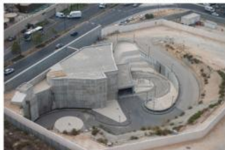
כך ייראה מעון ומשרד רה"מ החדש בצריף הלאום: לחצו על התמונה