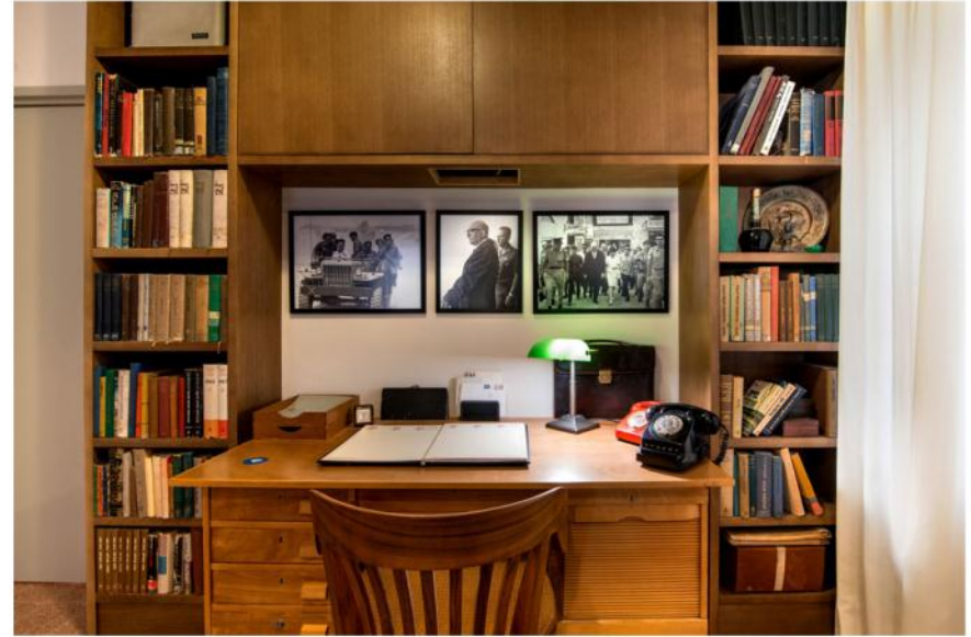
הסוויט מתנהל בקומת הקרקע, וחולף בדור העבודה. הקומה השנייה נתפסה ע"י החברה להגנת הטבע