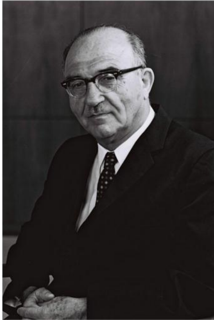
ללא תרומות פרטיות ועזרה מאוחרת ממשל, ההנצחה הזו לא הייתה מתרשלת. לוי אשכול, ראש הממשלה השלישי של מדינת ישראל