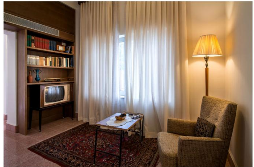
מימין אחריהם, רחוקים מקיסריה ומהנאות מנפתוח. ראשי הממשלה עברו לבית אגרון הסמוך