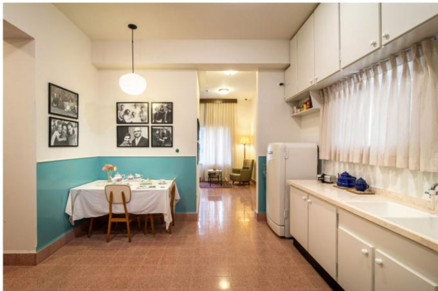
הכניו המפורסם "המסכתון" החל כאן, והתעצם בימיה של גולדה מאיר, כאשר החלטות גורליות התקבלו ליד הכיריים