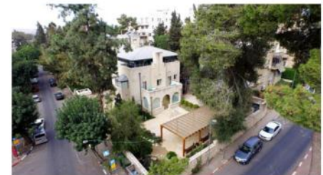
עמדות שמירה היו כבר אז, במגורים, שומרים ותיקה מתייביר - לא, השומר היה מדבר עם העוברים והשבים, נזיר המעבד שדול כאן

הז'אנר של בתי מגורים משוחררים, שנעודו להציג את אישיותם של מנהיגים ואנשי תרבות, הוא תופעה ותיקה בישראל. בית הסופר ש"י עגנון בתלפיות, בית הרב אברהם יצחק קוק ובית הצירוף אהרן טייטלבוים בירושלים, בית ביאליק ובית ראובן בתל אביב, בית השייח אמין טויף בגוליס, בתיהם של מנהיגי המתחרות איר שטרן בתל אביב ושרה אהרונסון גיבורת ניל"י בזכרון יעקב, וכמובן וילה ויצמן ברחובות ובתו של דוד בן גוריון בתל אביב ובקיבוץ שדה מקור. שני ראשי ממשלה שלזכרם הוקמו מוסדות הנצחה הם יצחק רבין ונחמה בגין.