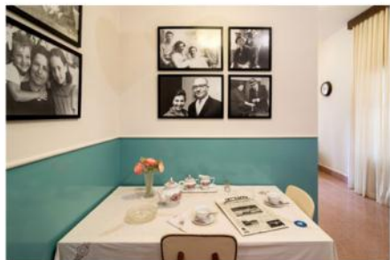
פינת האוכל הצנועה. הרו סעד ראש הממשלה את ארוחת הבוקר

נחילאי, שתכנן את התצוגה ב"בית הפלמ"ח" בתל אביב, את "החמאם הטורקי" בעכו העתיקה, את מרכז המבקרים במצדה ואת "מרכז שרשרת הדורות" ליד רחבת הכותל, בקיא בשילוב ערכים עם קדמה טכנולוגית. באופן שמאתר את התצוגה המוזיאלית המסורתית.