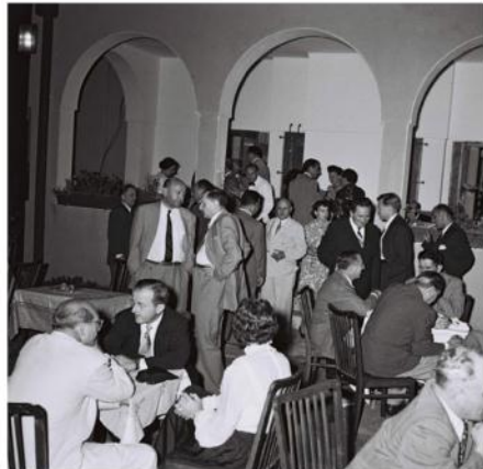
אירוע חברתי בתצור הווילה, בתקופת אשכול

סופו של בעל הבית הראשון היה מר. הוא נהרג במשדרו במלון הפאר "המלך דוד", בפיצוץ הקטלני שביצעו אנשי האצ"ל ביולי 1946. שנים ספורות לאחר מכן נהרג גם בנו, סנדי, בתאונת מטוס על חיל האוויר בעת שירות מילואים בבסיס חיל נוף. המשפחה עקרה לרחובות, ואחרי הקמת המדינה עבר הבית לבעלות המדינה, שהפכה אותו ב-1950 למעון הרשמי של ראש הממשלה.