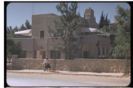
הבית עמד ריק, עקב חוסר תקציב לשפצו, הפך למשכנם של רוקמנים

"כך חלפה לה תהילת עולם", כתב האדריכל פיליפ ברנדיס בתיק תיעוד מוקדם שהוכן ב-2002. 28 שנים עמד בית לייקובש שמוס וטוש, בניגוד גמור לחיים השקוקים שידע כשיא תהילתו. בשנות ה-90 אף התגנבו לתווך צעירים חסרי בית וזרני סמים, והמשטרה נאלצה לפנותם ולאטום את הבית בבלוקים".