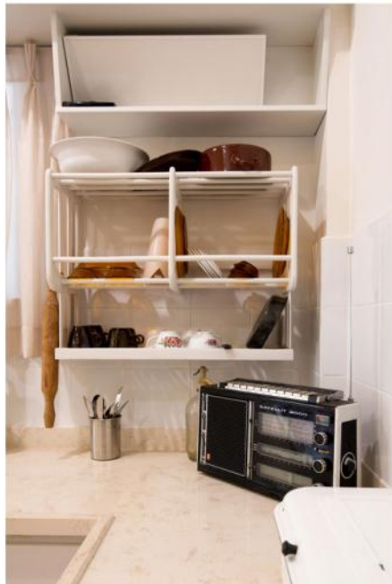
החיש ומייבש הכלים

"הולוגרמות ופעולות זרים למסר ולמקום", הוא מסביר, "ולק התאפקתי לא לעשות את זה. את הרהוט עשיתי בדיק כמו בבית הוריי. לא היה אז ייבוא מאיטליה, אלא היו הולכים לקנות הריסים בשק"ס". רק שולחן העבודה והכיסא של אשכול הם מקוריים. כל השאר שחזר על פי תמונות. "לאנשים קל להתחבר לסיפורים", מאמין נחילאי, "וקל יותר להתחבר לסיפור מאשר להנחית עליהם מידע על הראש. דרך הסיפור אני נכנס למערכת הרגש של המבקר, וברגע שנכנסתי לרגש, הפתיחות של המוח גבוהה יותר".