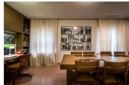
מסע בזמן. חדר האוכל ופינת העבודה

הסיוך חולף על פני חדר הבית בקומת הקרקע: הסלון, שבו מוקרן סרט על פועלו של האיש; חדר הטלוויזיה, שם נדלק לפתע מסך הטלוויזיה הישנה ומצטרף למהלך ההסבר, המטבח הענק, שהפך במיתוס הלאומי ל"מטבחון" שבו ראשי הממשלה (בעיקר גולדה מאיר) מקבלים החלטות; פינת האוכל הקטנה שבה סעדו בני הזוג אשכול את ארוחת הבוקר, קודם שלוי יצא לנהל את המדינה; ומוקדת סיום בחדר האוכל המרווח עם פינת העבודה הצמודה. מאן יוצאים למרפסת ולחצר.