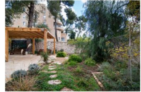
מתברר שאשכול עודד גידול ירקות ופירות. בחצר הנוכחית, מכל מקום, החברה להגנת הטבע נוכחת בהחלט

אלא שבניגוד למדינות מערביות גדולות, כמו ארצות הברית שבה כל נשיא בונה לעצמו ספרייה אדירה להנצחתו במימון ממשלתי מסודר, בישראל אין כל ערובה לכך שראש ממשלה יוציא, זה תלוי בעיקר בהתמנהגותם ובכספיהם של קרובי משפחה. כך יצא, שלדמויות משמעותיות בתולדות ישראל כמו גולדה מאיר, יצחק שמיר או משה דיין לא הוקם אף אתר שיספר על הערכים שהנחילו. אולי יש בכך מעלה מסוימת, מטעם שכך מנטרלים את הכוחות שאותם פוליטיקאים ביטאו בחייהם? "זו טעות קרדינלית", פוסק וידרמן. "אין כאן רק פולחן אישיות, אלא סיפור. סיפור שקובע את הרטיבי גם לעתיד, וכיום מדינת ישראל בורחת מלספר את הרטיבי שלה".