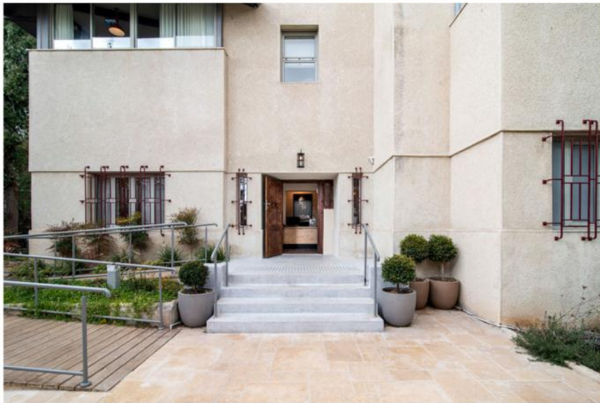
זו אחד הבתים היחידים ברחביה שאינם מחופה באבן ירושלמית, אלא מסויה במלאט, וזו אחת הסיבות להתבלטותו בשכונה